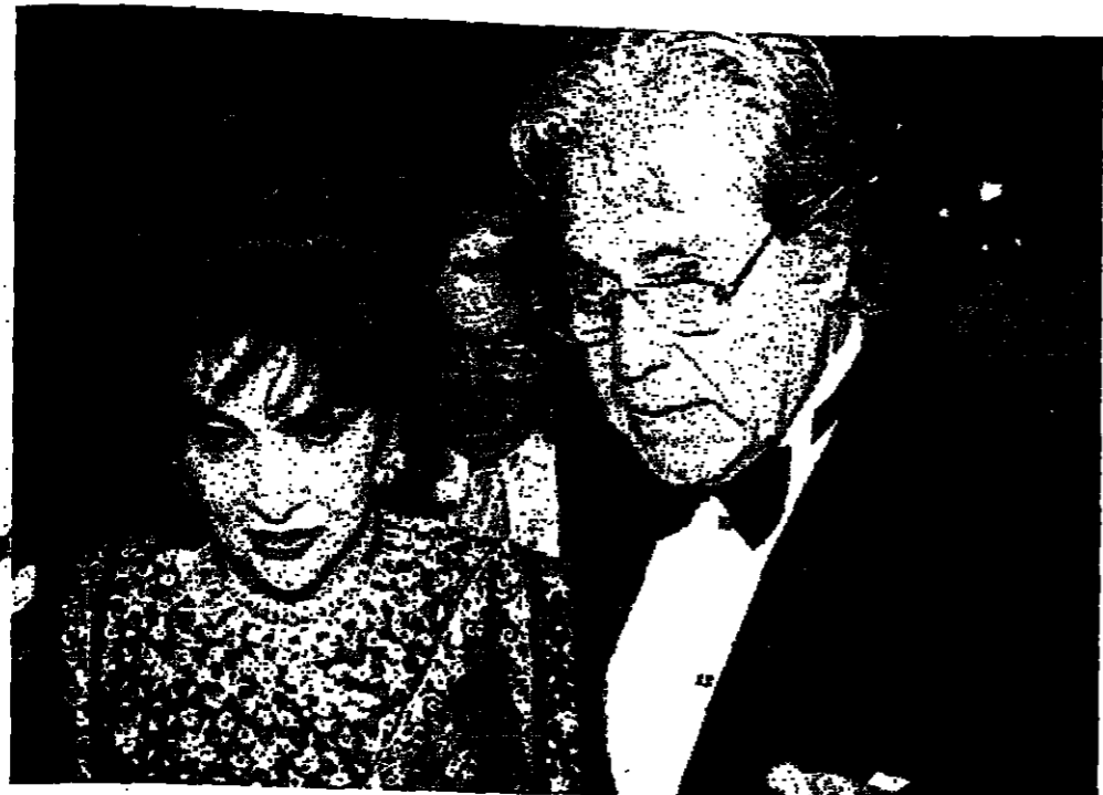
حسن فهمي وجينا لولو بريجيدا